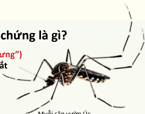
Muỗi sân vườn Úc